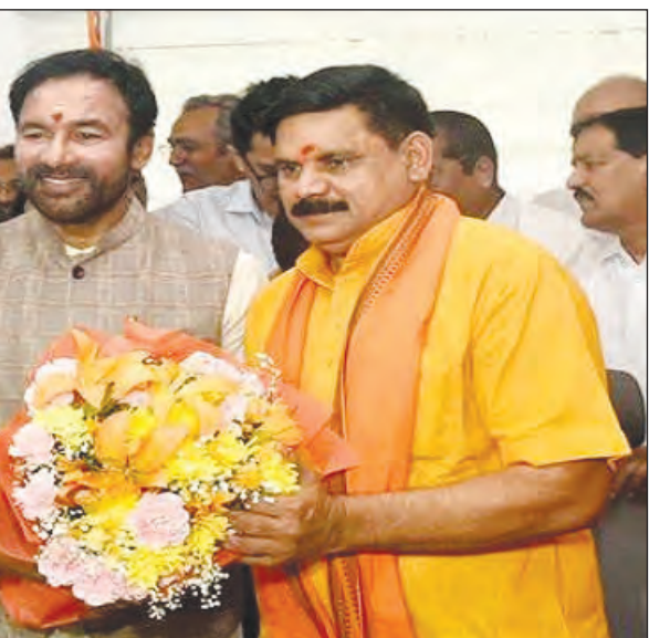
जी. किशन रेड्डी ने कोयला एवं खान मंत्रालय का कार्यभार संभाला।