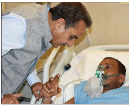
आग की घटना के बाद कुवैत यात्रा पर गए विदेश राज्यमंत्री कीर्तिवर्धन सिंह ने घायलों से मुलाकात की।